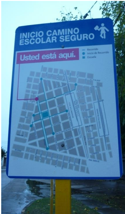
soportes para la señalización vertical de Inicio de Camino Escolar con poste de metal Medidas de la chapa: 80 x 60 cm