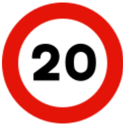
Límite de Velocidad Máxima R15