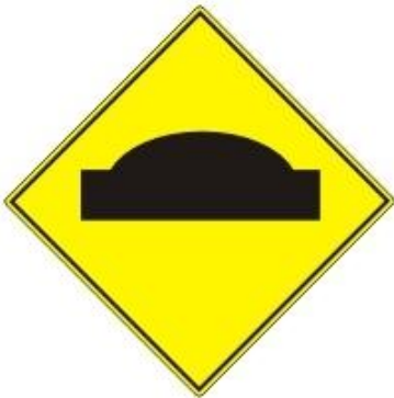
Perfil Irregular (Lomada) P11 Con su respectivo poste.